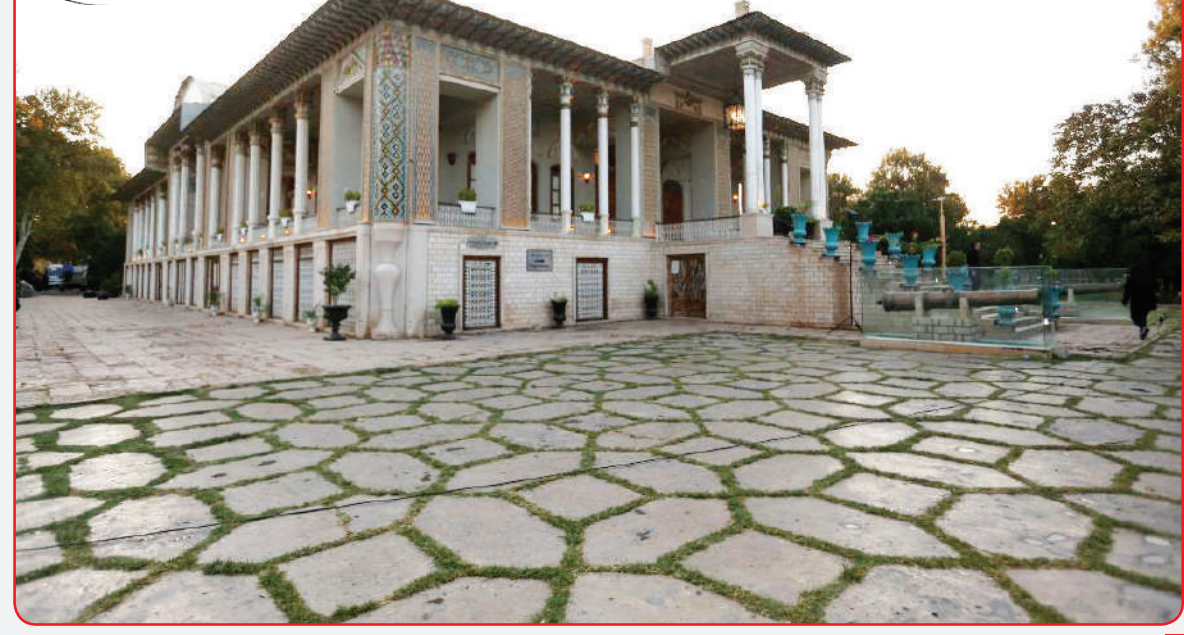
باغ عتیق‌آباد - شیراز