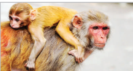
باغ وحش - بنگلادش