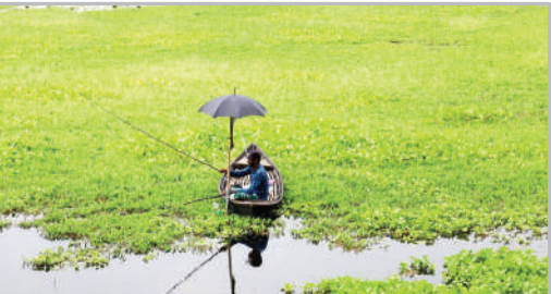
ماهیگیری در باتلاق