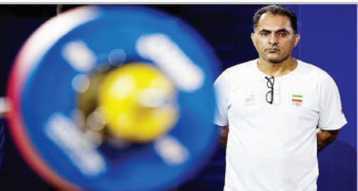
بازی‌های آسیایی هانگ‌و - مسابقات وزنه برداری