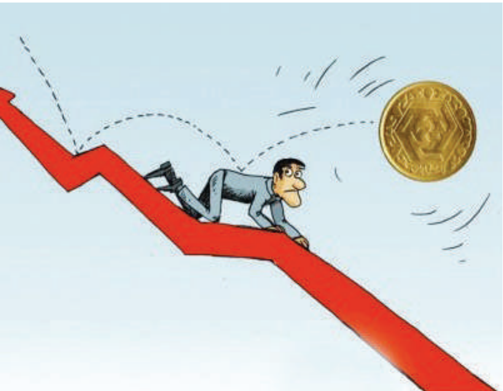
ثبات قیمت سکه و طلا